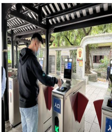
电子票务系统使用