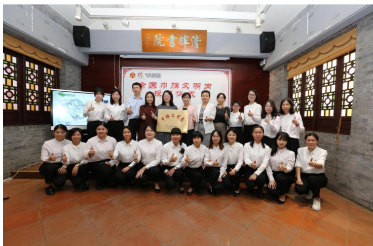
我馆研究推广服务部（原业务部）获评“全国巾帼文明岗”称号

2021 年 3 月，我馆研究推广服务部（原业务部）获评“全国巾帼文明岗”；5 月，区绩效管理工作联席会议办公室通报 2020 年度区属事业单位绩效考核结果，清晖园博物馆获评优秀等次；6 月，中共佛山市顺德区清晖园博物馆支部委员会获评“顺德区先进基层党组织”；11 月，我馆“清晖学堂”项目获省教育厅颁发广东省“终身学习品牌项目”。