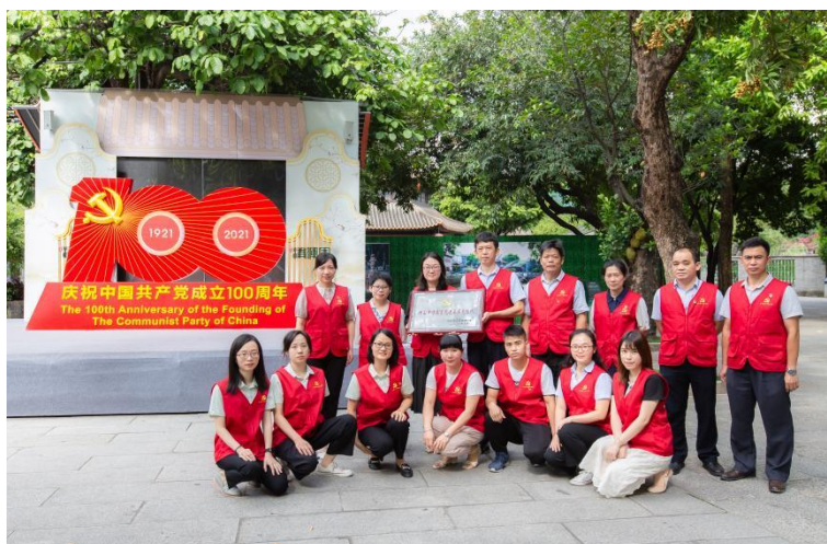
本馆支部委员会获评“顺德区先进基层党组织”