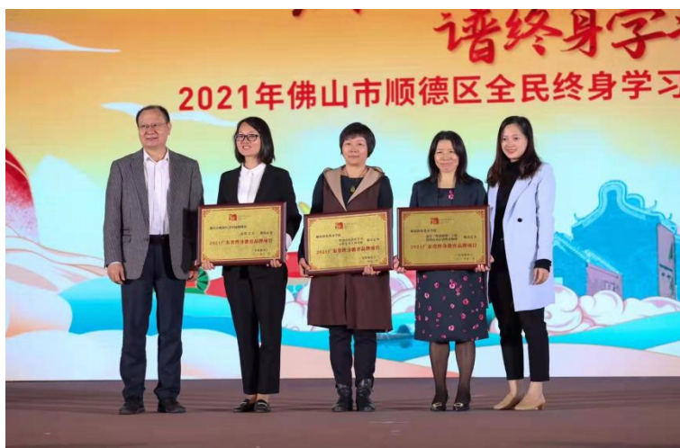
“清晖学堂”项目获省教育厅颁发广东省“终身学习品牌项目”